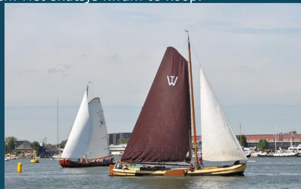
* De Ora et Labora in actie tijdens Sail Amsterdam 2010