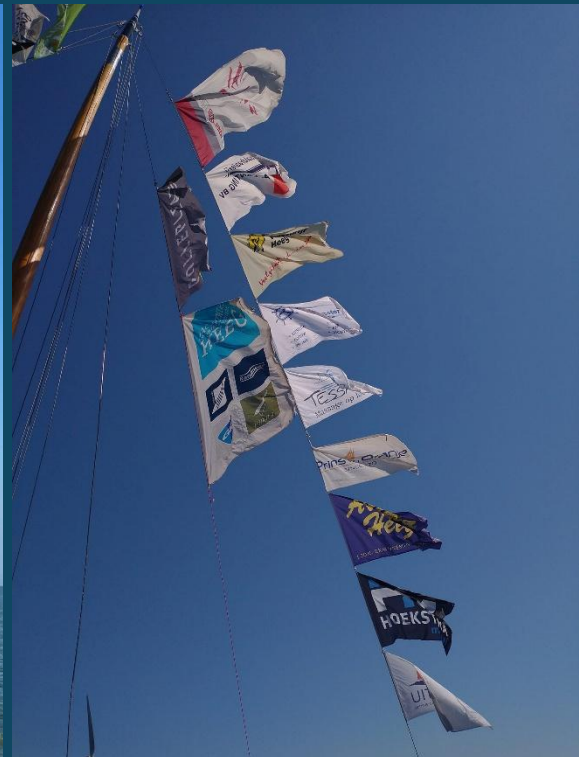
Bedrijfsvlaggen in de vlaggenlijn.