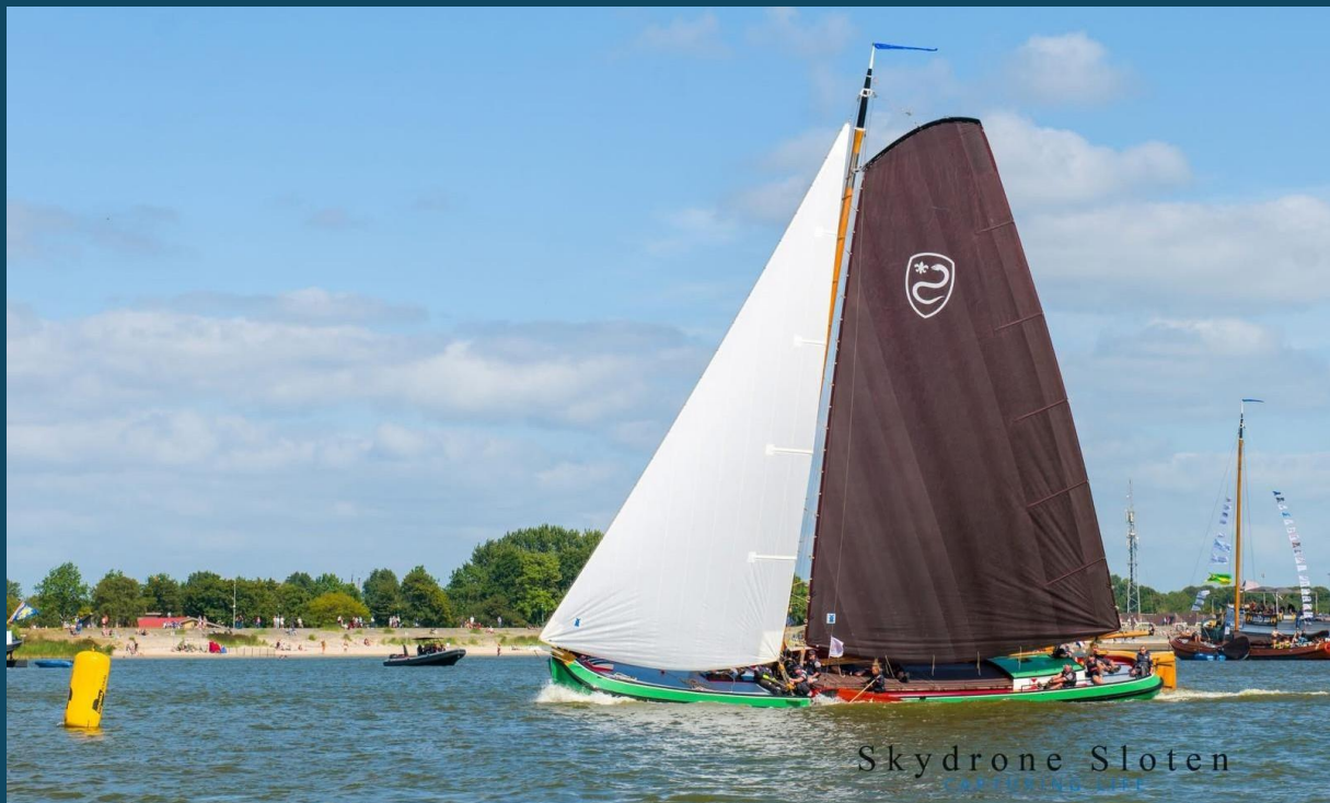
*Als 3 e om te boventon tijdens de IFKS in 2025

Zeilen zit de Friezen in het bloed. Dit komt het beste naar voren als er op het scherpst van de snede wordt gestreden om het kampioenschap. Dit spektakel is tot ver buiten Friesland onderhand wel bekend. Naast de SKS klasse, met 14 vaste skûtsjes, is er ook een open skûtsje klasse, de Iepen Fryske Kampioenskippen Skûtsjesilen of kortweg IFKS, waarin ruim 65 skûtsjes in verschillende klassen strijden om de eer. De Ora et Labora komt als het Heegemer skûtsje uit in de hoogste klasse, de A-Klasse.