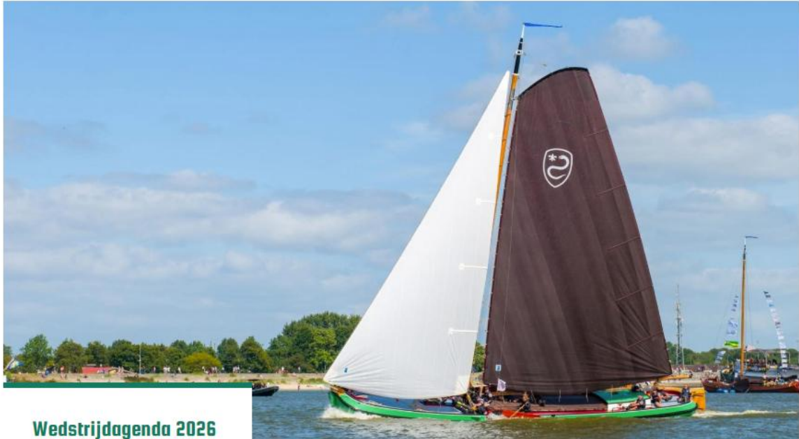
Naamsvermelding hoofdsponsor op startpagina website.