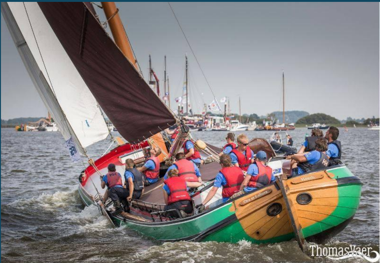
Skûtsjesilen met 12 personen.