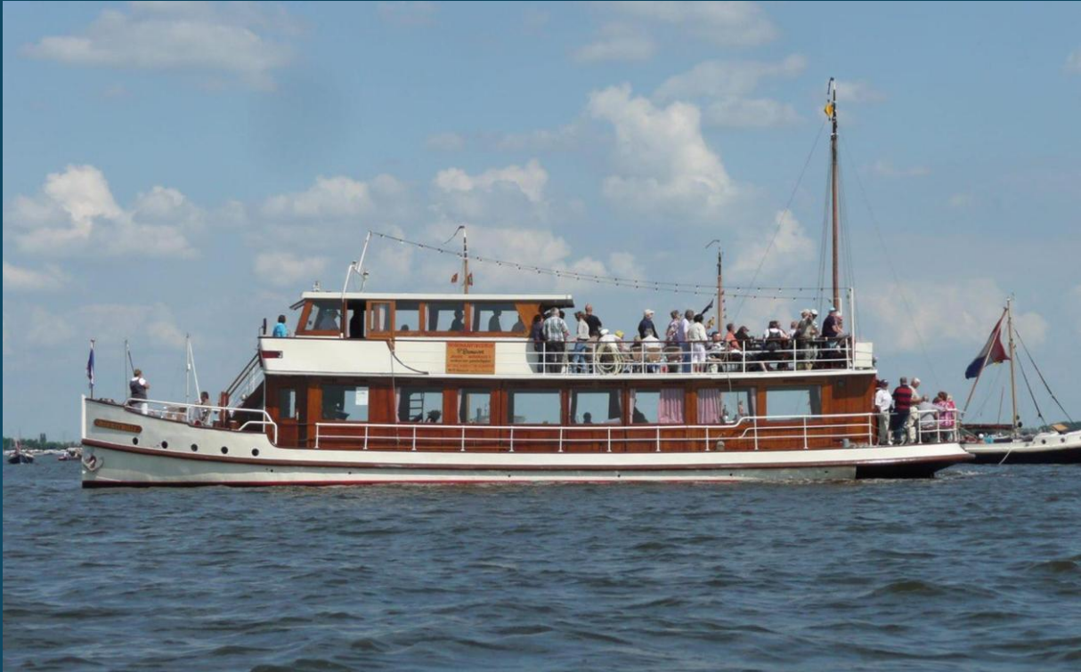
Uitnodiging voor salonboot Simmerwille o.g.